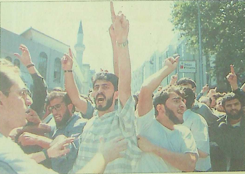
Özel, provokasyonla suçlanan İBDA - C gibi grupların Refah görüşünün parçası olmadığı fikrinde.

YARIN: İslami cemaatlerin Refahyol şaşkınlığı