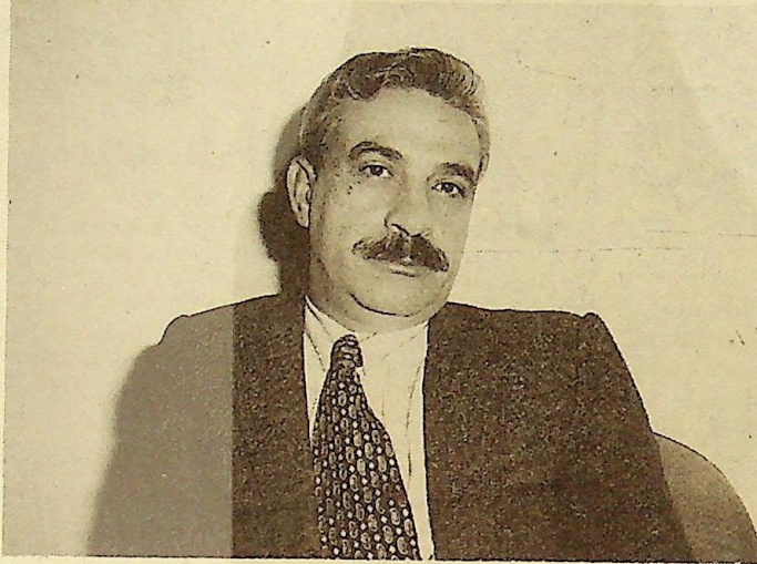
İsmet Özel yine edebiyat dünyasının gündeminde.