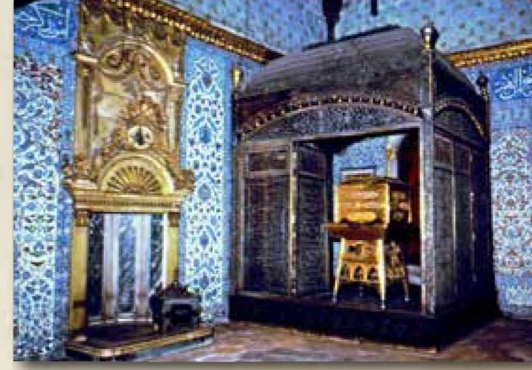
Topkapı Sarayı Has Oda'da Hırka-i Saadet'in muhafaza edildiği gümüş şebeke ve altın sanduka Fatih / İstanbul

Yine onun 23 Nisan 1922'de ka- leme aldığı "Ezansız Semtler" yazı- sında dile getirdiği şu hususlar ha- fızalardan hiç silinmeyecektir: "Biz ki minareler ve ağaçlar arasında ezan seslerini işiterek büyüdük. O